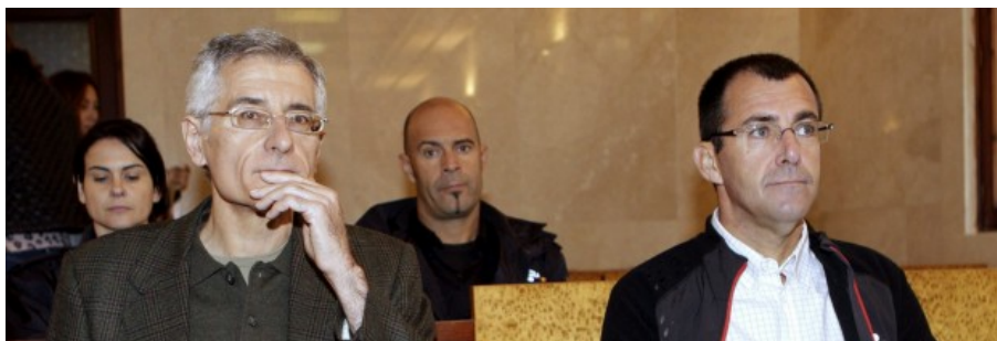
El exconseller de Territorio del Consell de Mallorca Bartomeu Vicens (i), y el exvicepresidente del Consell de Mallorca Miquel Nadal, al inicio del juicio sobre un "pelotazo" urbanístico en el polígono de Son Oms.